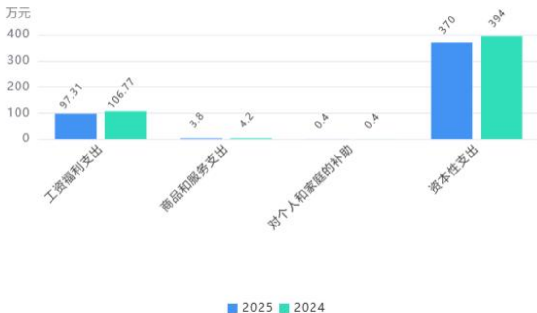
支出按部门预算支出经济分类对比图

2. 按照政府预算支出经济分类，本单位当年一般公共预算支出471.50万元，其中：