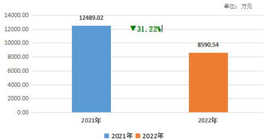
一般公共预算财政拨款支出决算情况

2022 年度财政拨款收入总计、支出总计均为 10,190.54 万元，与上年相比收入总计、支出总计各减少 5,221.16 万元，下降 33.88%。主要原因是项目支出减少。